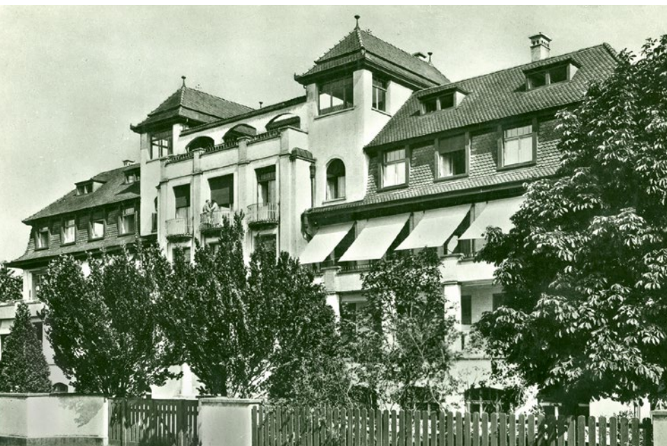
Das 1918 eröffnete, erste Gebäude der Merian Iselin Klinik