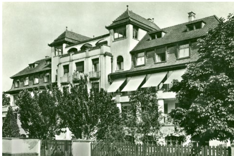
Das 1918 eröffnete, erste Gebäude der Merian Iselin Klinik